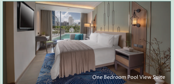
One Bedroom Pool View Suite

73/7-8 Sukhumvit Soi 13, Bangkok 10110, Thailand www.nysahotelbangkok.com